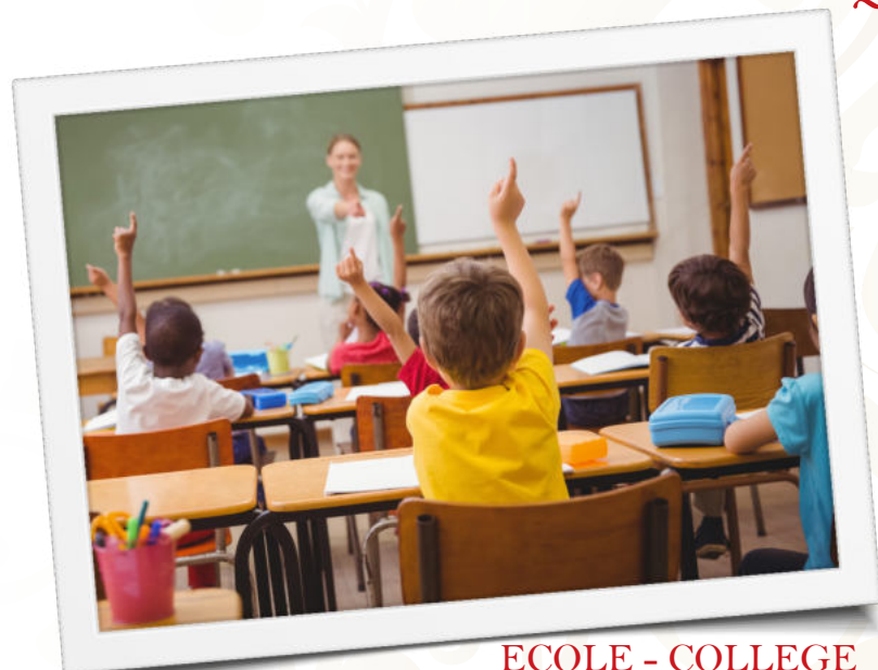
ECOLE - COLLEGE