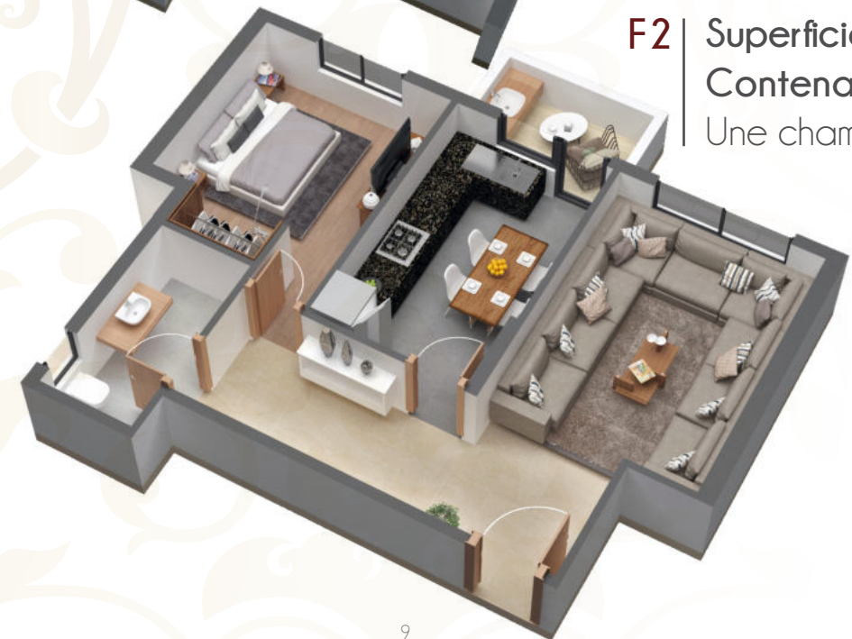
F2 Superficies : 50m 2 Contenance : Salon, Une chambre, Cuisine, SDB,