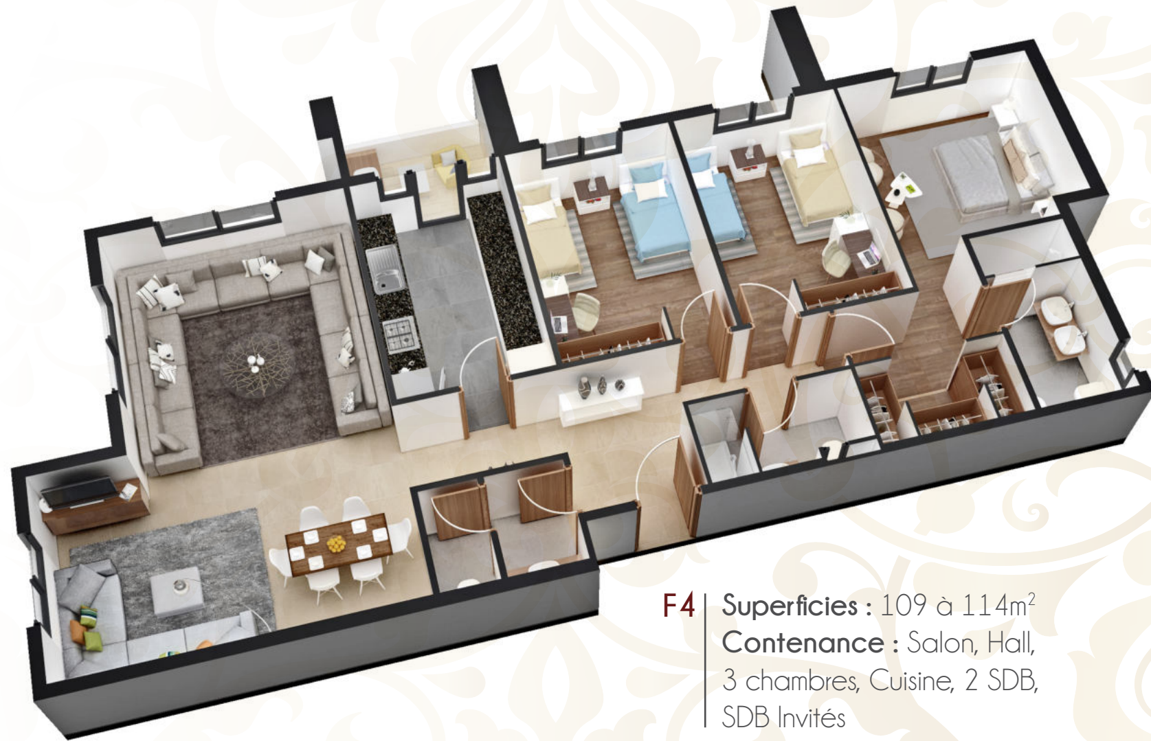
F4 Superficies : 109 à 114m 2 Contenance : Salon, Hall, 3 chambres, Cuisine, 2 SDB, SDB Invités