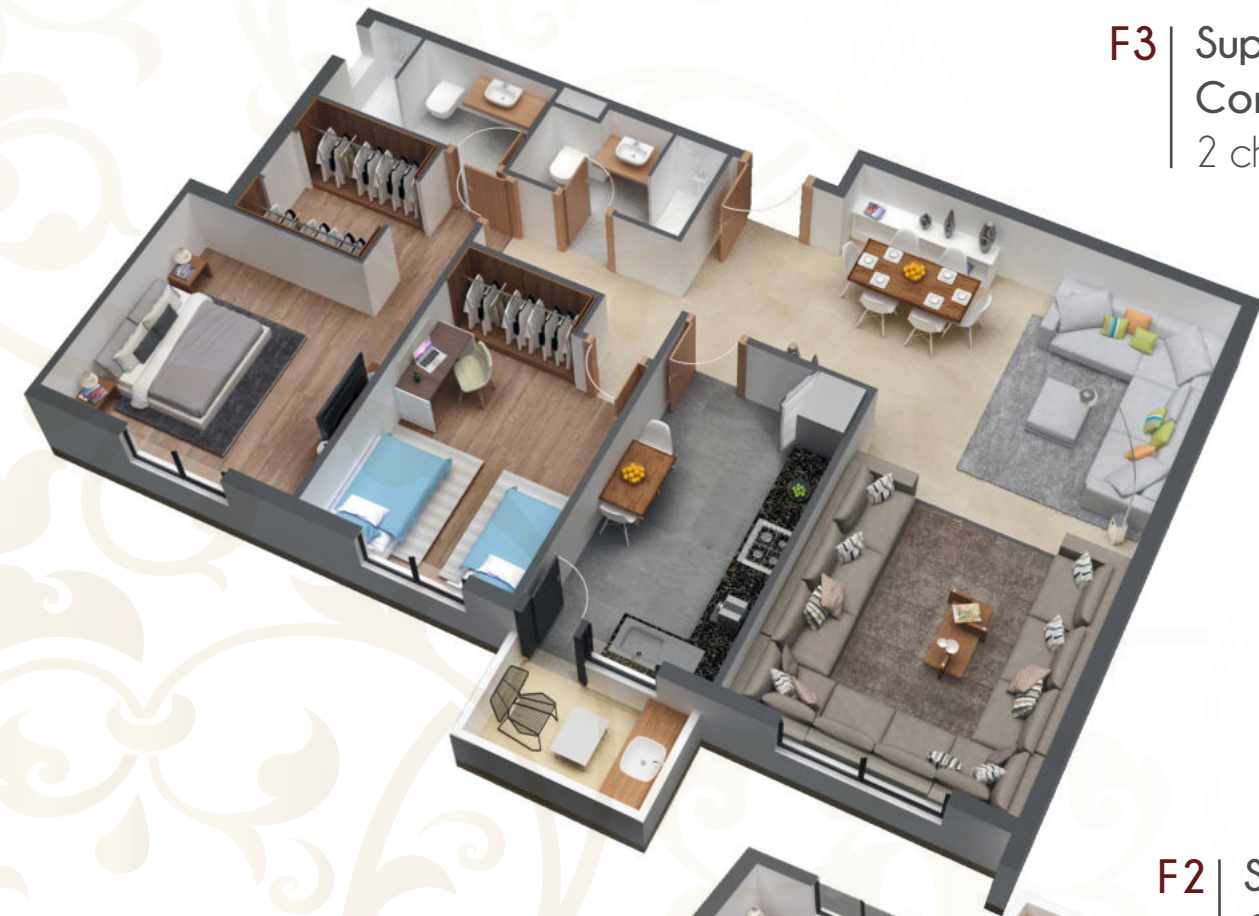
F3 Superficies : 84 à 87m 2 Contenance : Salon, Hall, 2 chambres, Cuisine, 2 SDB,